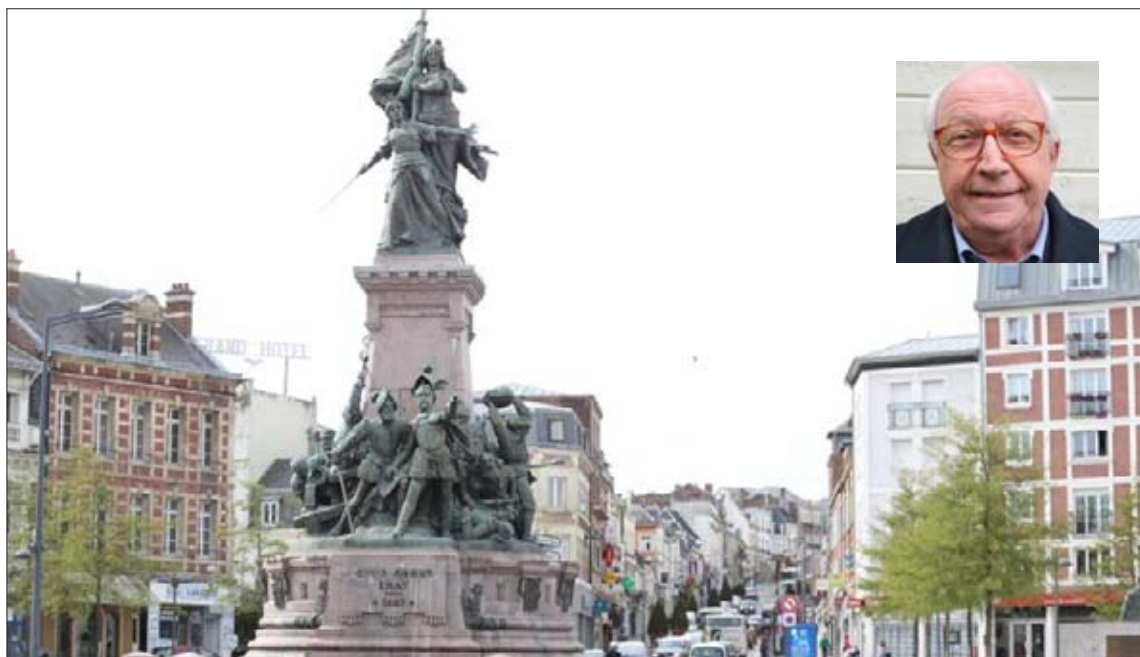
Le monument de 1557 célèbre le sacrifice de la population saint-quentinoise face aux troupes espagnoles.